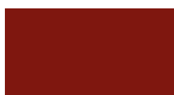
rosso bruno ral 3011