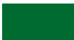
verde smeraldo ral 6001