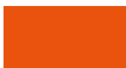
arancio puro ral 2004