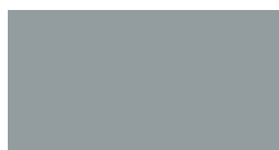
grigio argento ral 7001