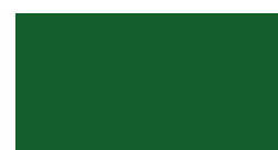
verde foglia ral 6002