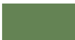
verde reseda ral 6011