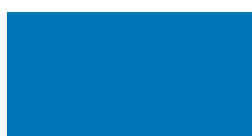
blu cielo ral 5015