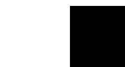
bianco ral 9010