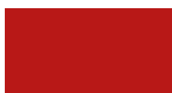
rosso fuoco ral 3000