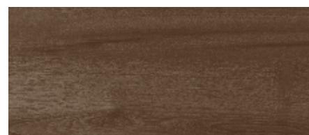
360 noce scuro